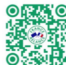
Tableau des lauréats

Pour connaître directement ce que la relance permet près de chez soi, demandez-le ici : http://bit.ly/relancechezmoicvl